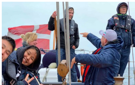
På sejltur med skibet "Sirocco"

Weekenderne har sine egne tider og der er altid planlagt et godt program.