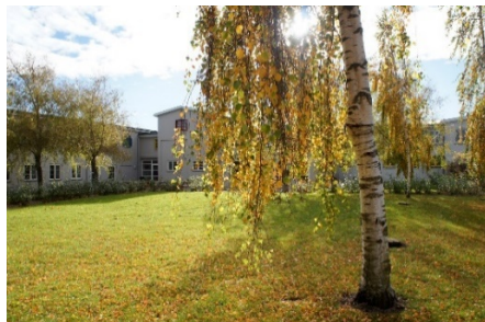
Hovedindgangen til Opholdsstedet

Opholdsstedet er delt op i tre afdelinger: 1. salen, stuen og husene.