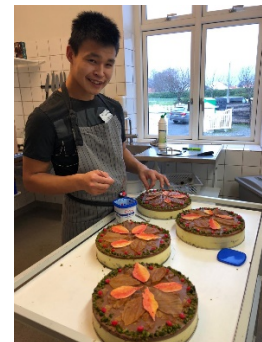
Nogle elsker at bage