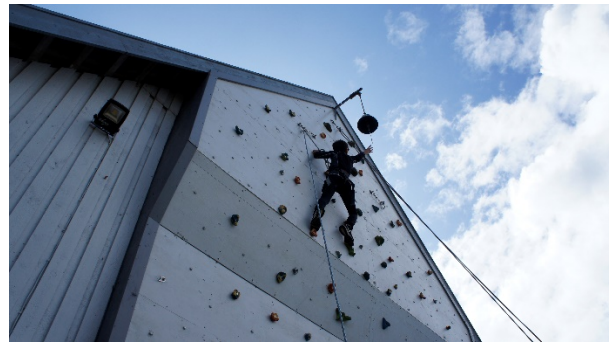
Til OL på Tvind