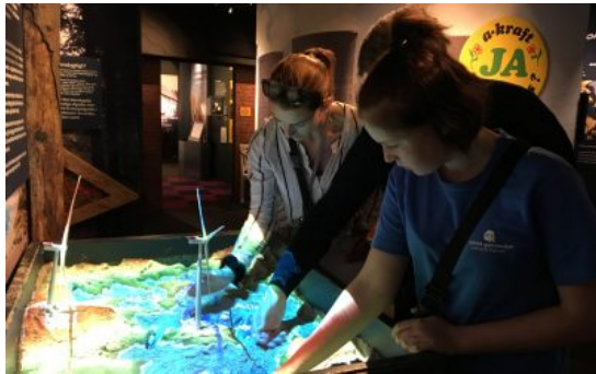
På ekskursion til Økolariet – lære om natur

Det giver mange gode oplevelser og man glæder sig til at mødes igen.