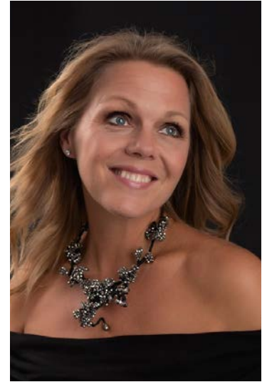
Miah Persson, sopran