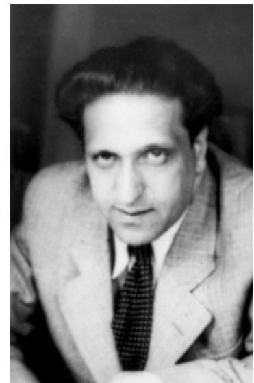
Pavel Haas (1899 -1944)

“- Pavel Haas som ikke nåede at gøre den færdig, fordi han blev deporteret til Auschwitz og myrdet dér.”