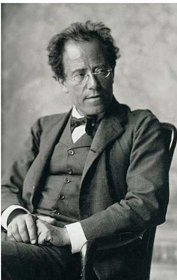
Gustav Mahler (1860 - 1911)

“Den østrigske komponist Gustav Mahlers fantastiske musikalske verden er fuld af skønhed, humor, underfundighed”